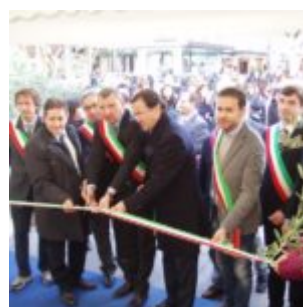
OLYMPUS DIGITAL CAMERA