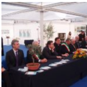
OLYMPUS DIGITAL CAMERA